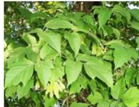
Ясенелистный (американский) клён